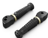
Zakázkové stupačky spolujezdce